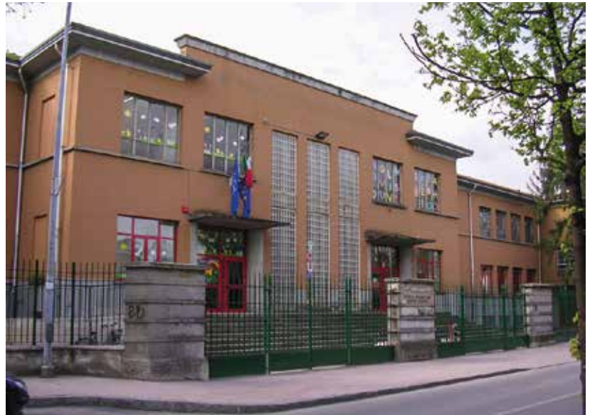
Scuola primaria Gavazzi

"I lavori sono stati eseguiti rapidamente e in condivisione con i dirigenti degli Istituti –