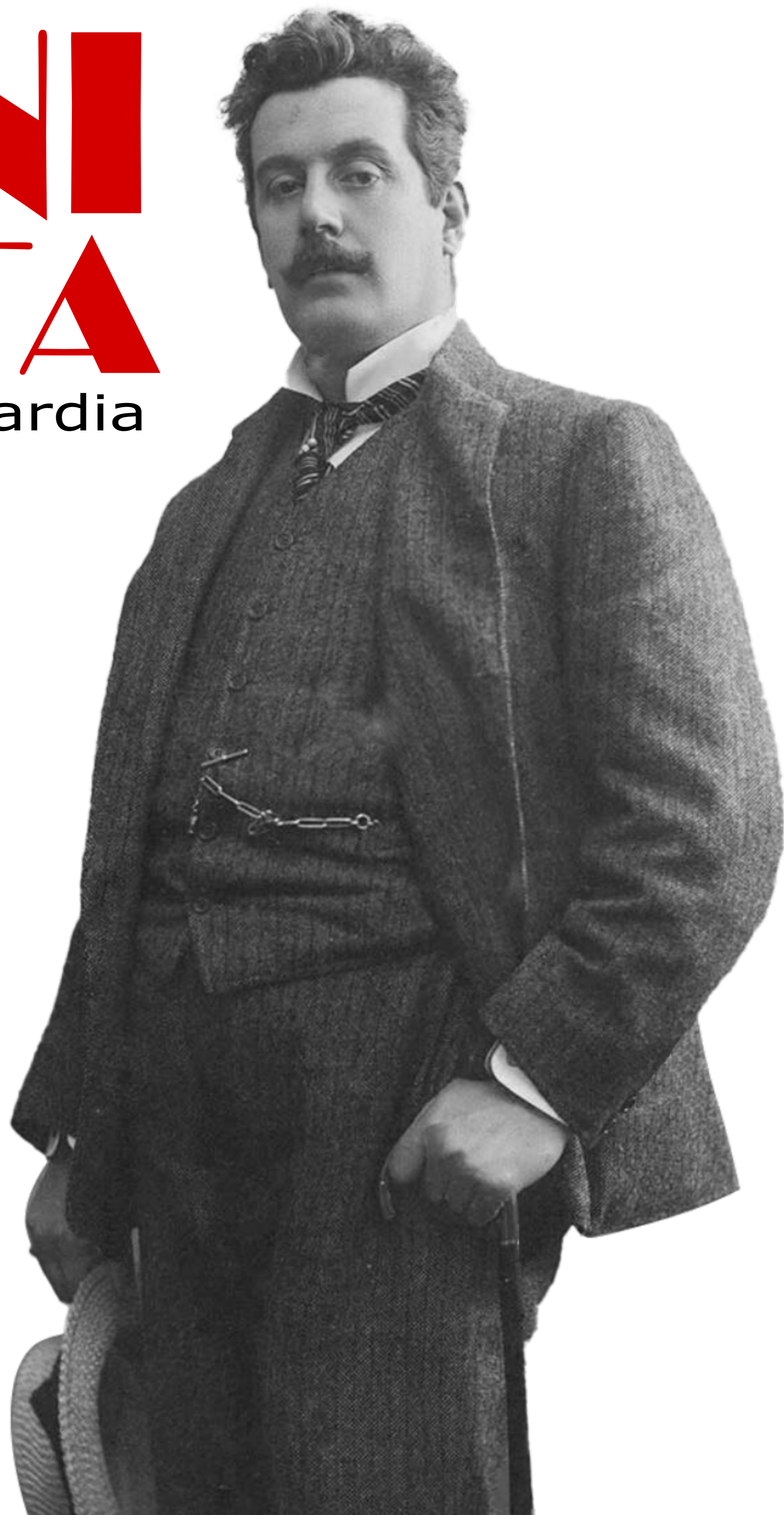
Una foto autografata da Puccini con il suo Ricochet #24.