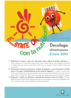
3 - Decalogo Alimentazione