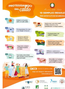
2 - 10 Regole