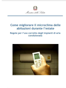
5 - Come migliorare il microclima nelle abitazioni durante l'estate