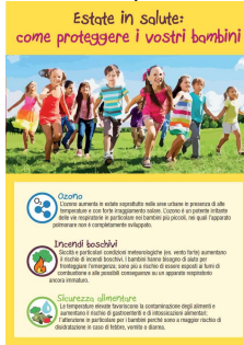
4 - Come proteggere i vostri bambini