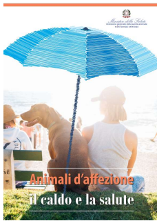
7 - Animali di affezione