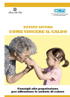
6 - Consigli alla popolazione per affrontare le ondate di calore