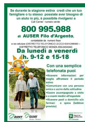
15 - AUSER