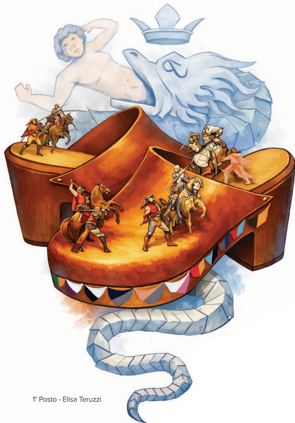
1° Posto - Elisa Teruzzi