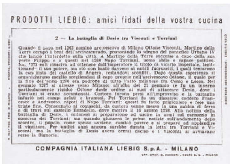
La battaglia di Desio tra Visconti e Torriani Figurina Liebig